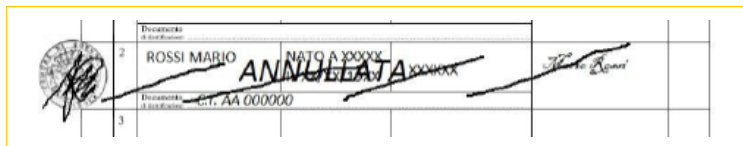
Esempio di annullamento firma raccolta

A questo punto la sottoscrizione non dovrà essere conteggiata nell'autentica. Quindi per esempio se il foglio contiene 39 firme corrette e 1 annullata, il numero di firme che dovrà essere riportato è 38.